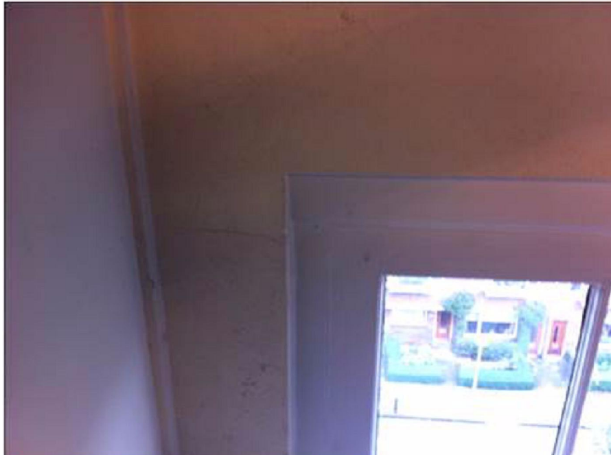
De Expeditie, Wibenaheerd 24 Scheuren in muren. Geen acuut gevaar.