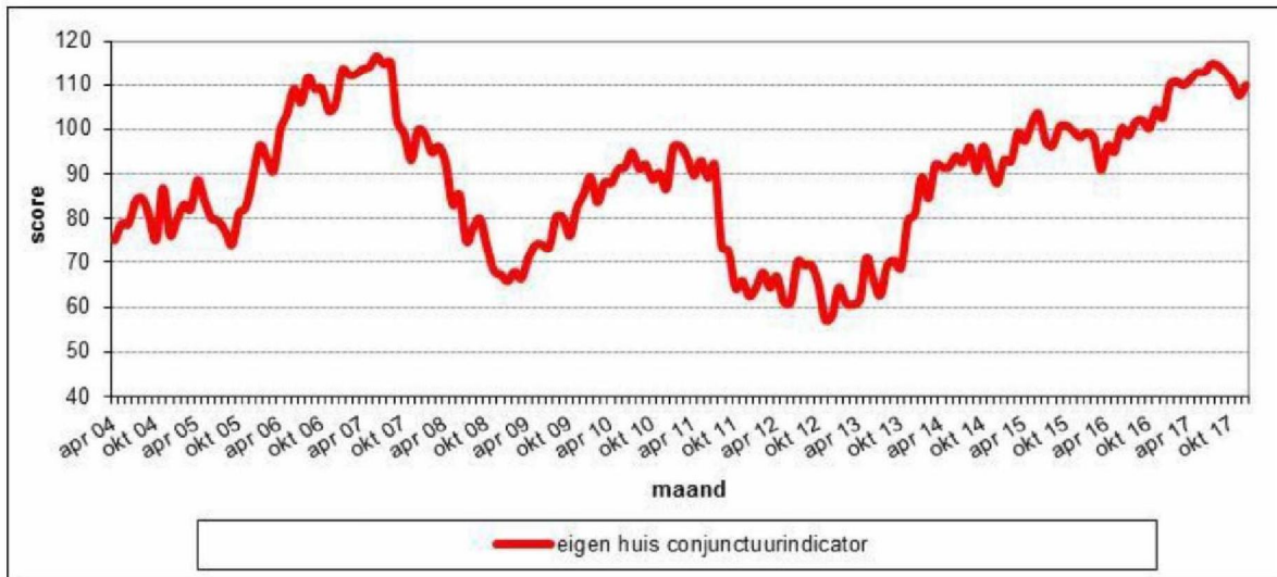
Figuur 2.3 De gemiddelde scores op de Eigen Huis Conjunctuurindicator, op maandbasis in de periode april 2004 – december 2017, in Nederland