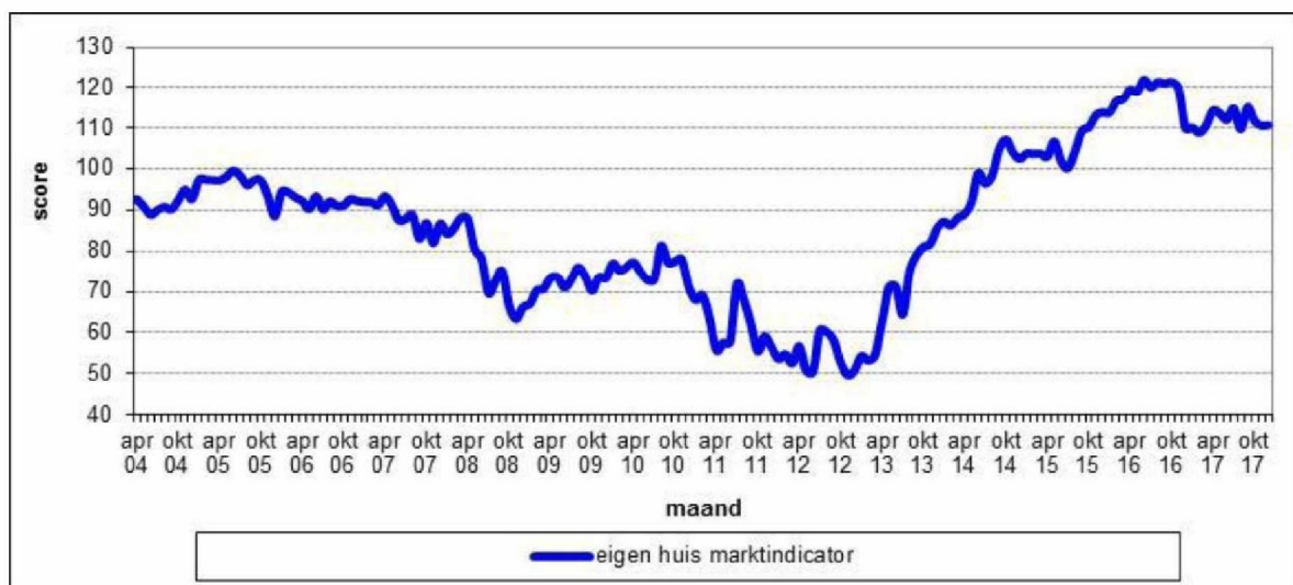
Figuur 2.1 De gemiddelde scores op de Eigen Huis Marktindicator, op maandbasis in de periode april 2004 – december 2017, in Nederland