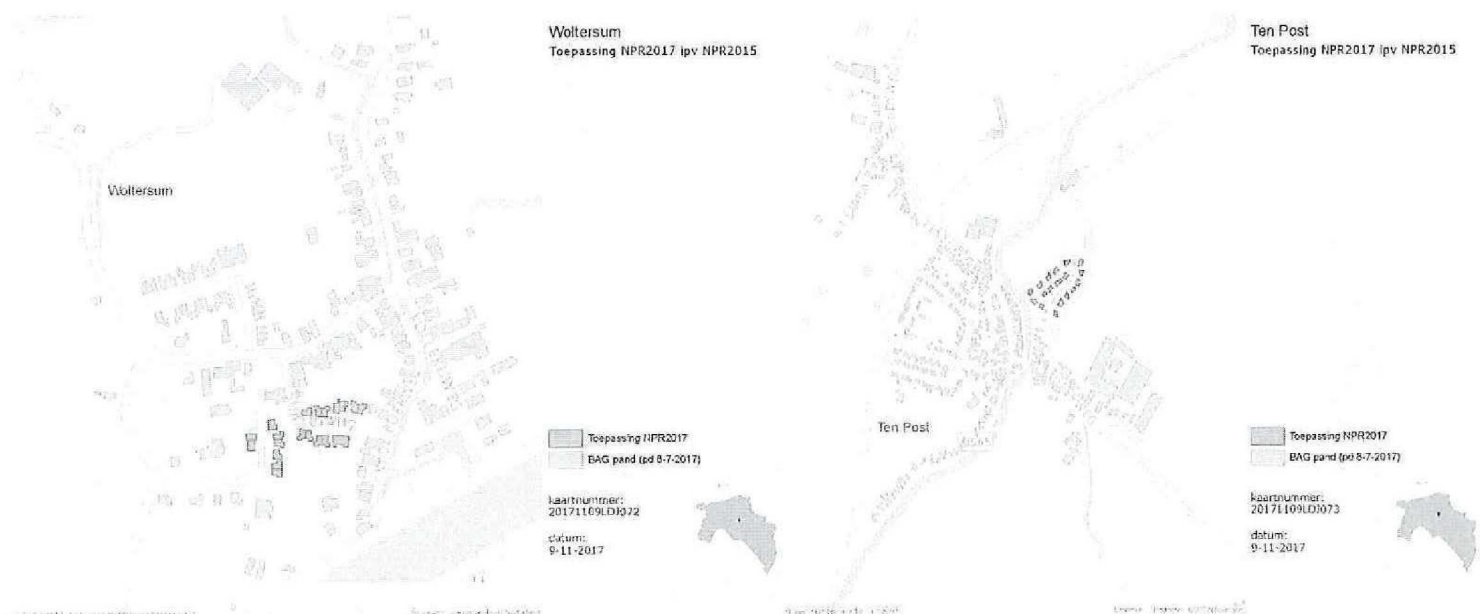
Figuren 1 en 2: Gebieden waar i.p.v. NPR 2015 NPR 2017 wordt toegepast.

NCG handhaaft het beleid dat enkel per 1 januari en 1 juli de kaders kunnen wijzigen (op basis van onafhankelijk gevalideerde informatie). In dit kader is in het Addendum op het MJP 2017-2021 opgenomen dat alle gebouwen uit inspectieprogramma's gestart voor 1 juli 2017 worden getoetst aan NPR 9998:2015. Gebouwen uit inspectieprogramma's gestart per 1 juli 2017 worden getoetst aan NPR 9998:2017. In dit MJP wordt teruggekomen op dit besluit voor twee gebieden: de nieuwbouwwijk in Ten Post en een aantal woningen in Woltersum. Gebouwen in deze twee gebieden worden getoetst aan NPR 9998:2017. De toelichting staat hieronder bij de betreffende kaarten.