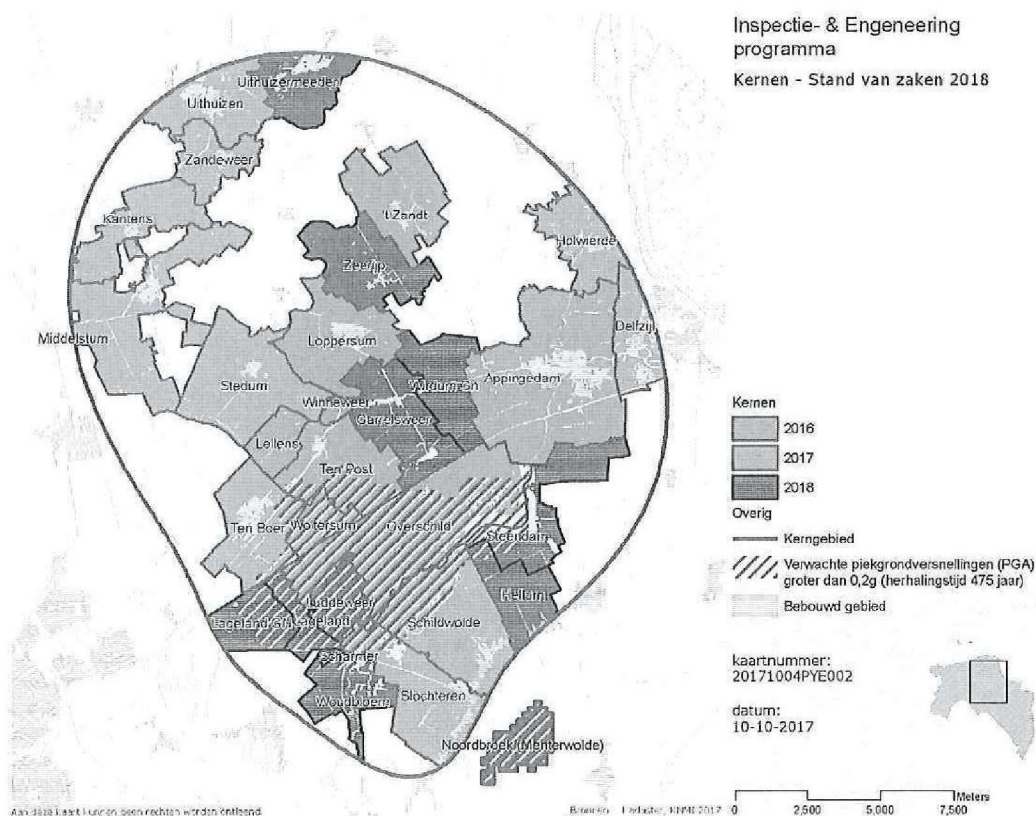
Figuur 7: Kernen voor het Inspectie & Engineering Programma 2016-2018

Mocht besloten worden om de inspectiedoelstellingen in aantal naar beneden bij te stellen (zie paragraaf 2.1), dan kan dit als consequentie hebben dat niet in alle genoemde kernen in 2018 gestart wordt met inspecteren.