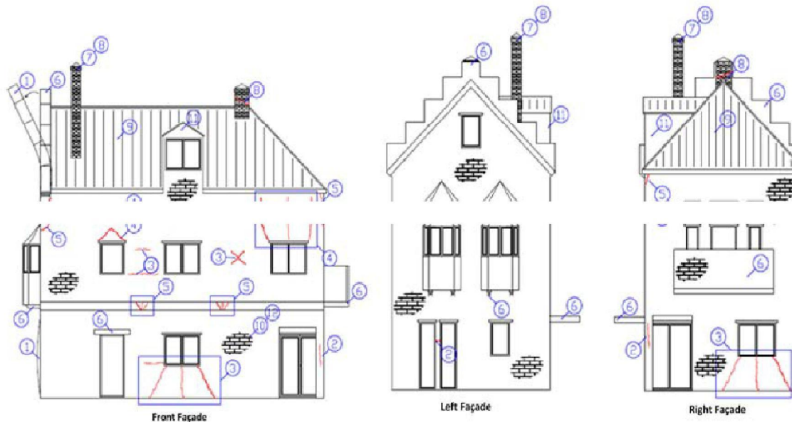
(figuur 1 overzicht gebouwelementen)