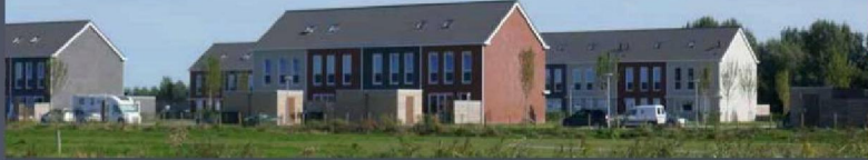
Tijdelijke huisvesting aan de Boersterweg