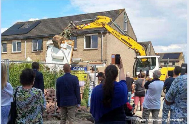
Sloop eerste woning Fazanthof

Ziet u één van deze collega's lopen in Ten Boer? Maak gerust even kennis met ze!