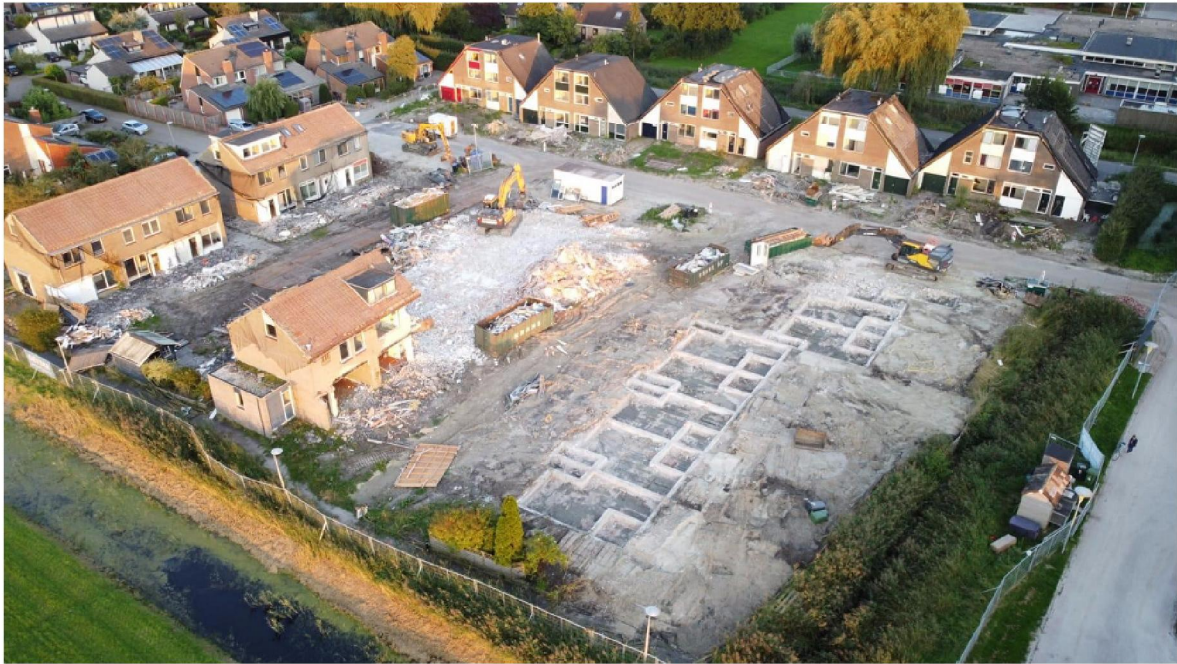
Sloop Fazanthof, Ten Boer (september 2020).

We hebben via de lokale stuurgroep afgelopen jaar nog woningen aan de versterkingsopgave toegevoegd. Het gaat hierbij dit jaar om vier woningen die wij vanwege de situatie van de woning en haar bewoners, een hoge prioriteit voor aanpak hebben meegegeven. Daarnaast hebben wij in twee buurten, te weten de omgeving rondom Fivelstraat/Ommelanderstraat en omgeving Boltweg (beide in Ten Boer), 85 woningen aan de werkvoorraad toegevoegd om de samenhang in deze gebieden te behouden.