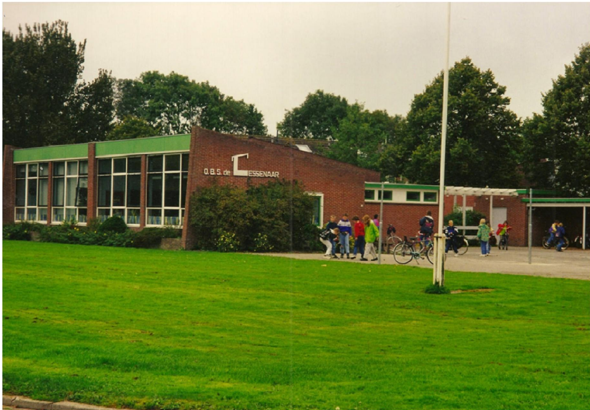
De Lessenaar, Ten Post (eind jaren 80).

Het versterken en vernieuwen van de dorpen in het aardbevingsgebied is een complexe taak. We werken daarom continu aan de ontwikkeling van het programmteam Versterken en Vernieuwen (V&V). Er werken nu drie gebiedsregisseurs en een groot aantal projectmedewerkers. Zij zorgen voor de dagelijkse afstemming van werkzaamheden en prioritering daarvan in de dorpen, zodat versterking van de woningen en dorpsvernieuwing gecoördineerd uitgevoerd kunnen worden.