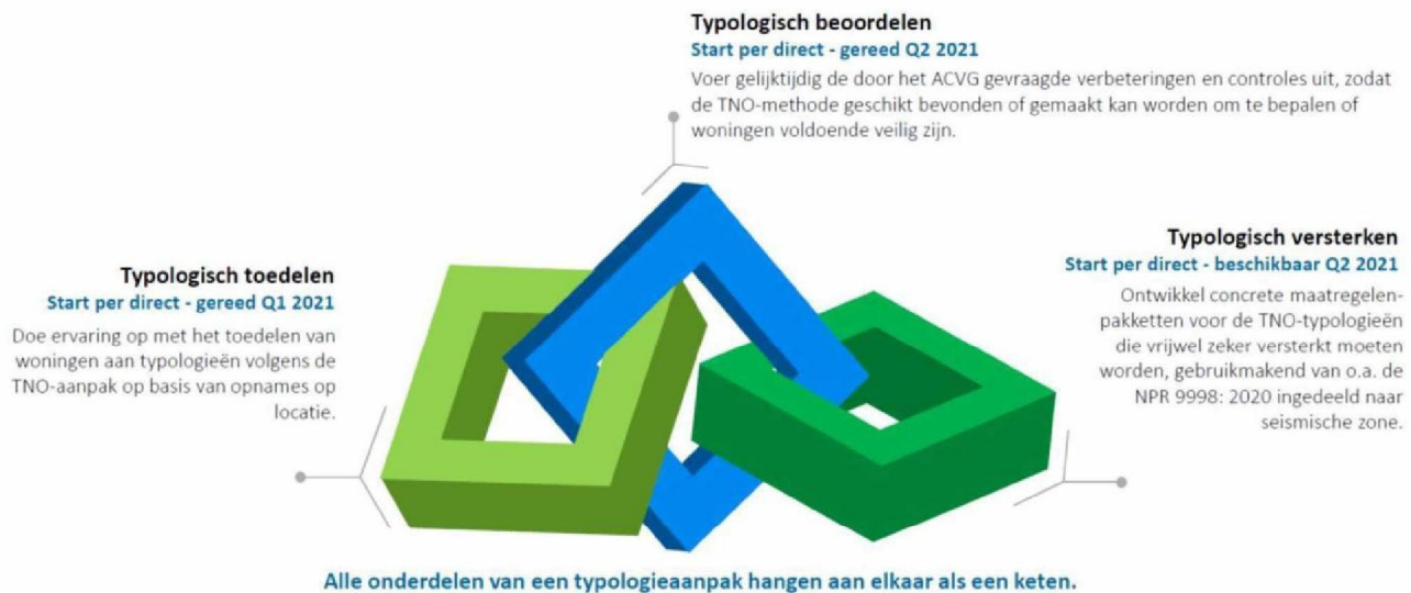
Figuur 2: De drie trajecten binnen de integrale aanpak.

met een beperkte versterkingsmaatregel alsnog binnen een typologie valt. Zo vormen typologisch toedelen, beoordelen en versterken één integrale keten (zie ook figuur 2).