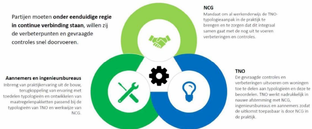
Figuur 1: Partijen moeten via een (project)sturing in continue verbinding staan, willen de verbeterpunten en gevraagde controles snel worden doorgevoerd.

Wij adviseren u om binnen de NCG een aparte sturing op de typologieaanpak in te stellen met aan de leiding een ervaren en gezaghebbende projectdirecteur komende uit de bouwsector. Hij of zij is lid van het MT en moet het mandaat hebben om al werkenderwijs de TNO-typologieaanpak in de praktijk te brengen en te zorgen dat dit integraal samen gaat met de nog uit te voeren verbeterpunten en controles. De projectdirecteur zorgt voor een gezamenlijke inzet en betrokkenheid van TNO, NCG, ingenieursbureaus en aannemers om de theorie met de praktijk te verbinden (zie figuur 1). Hierdoor ontstaat focus en naar de overtuiging van het ACVG ook voortgang en tempo.