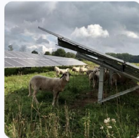
Opwek duurzame energie