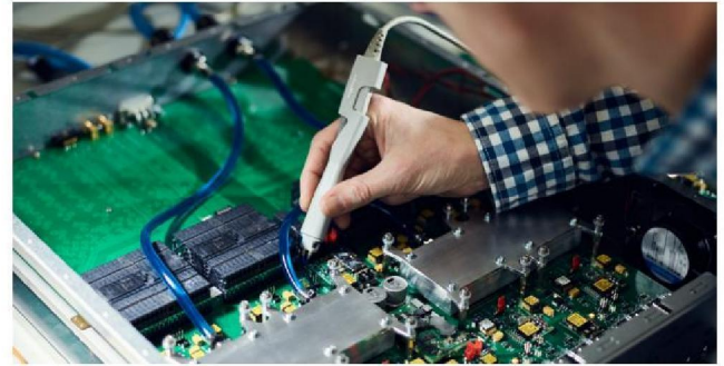
ASTRON ontwikkelt zelf technologieën die uiteindelijk hun weg naar de markt vinden.