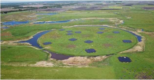
LOFAR bestaat uit 38 antennestations in Noord-Nederland, met nog eens 14 stations in 7 Europese landen.